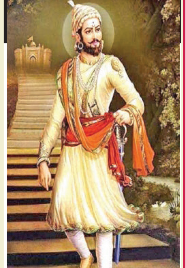
સિંદુરીયા થાપા આભાર: સાધના પુસ્તક પ્રકાશન ભાગ-50

રાજ્યાભિષેકના સમારંભ બાદ એક પછી એક લોકો રાજગદમાંથી વિદાય થઈ રહ્યા હતા. છેલ્લા બેએક મહિનાથી રાજ્યાભિષેકની તૈયારીઓ ગાજી રહેલો રાજગદ હવે શાંત બનતો જતો હતો. આવા અવસરે આખતજનોની વિદાયનો પ્રસંગ એ અવસરના આનંદ જેટલો જ તેથી વધુ શોકભર્યો બની જતો હોય છે. છતાં, મન કઠણ અને મોં હસતું રાખીને શિવાજી મહારાજ વિદાય લેતા સૌને કુશળ-મંગળ પૂછી, ફરી આવા અવસરે મળશું એવી ભાવના વ્યક્ત કરી, વિદાય આપતા હતા. પરંતુ, જીજ્ઞાસાને વિદાય આપતાં તો મહારાજનું હૈયું હાથ ન રહ્યું. જીજ્ઞાસાની તબિયત થોડા સમયથી અસ્વસ્થ હતી. રાજ્યાભિષેક પછી ચોમાસું શરૂ થતું હતું અને રાજગદ પર ફૂકાતી ચોમાસુ હવા જીજ્ઞાસા માટે કષ્ટદાયી બને તેમ હતી. જીજ્ઞાસાએ જ રાજગદ પાસેના નીચે પાચાડ ગામમાં પાછા પહોંચી જવાનું નક્કી કર્યું હતું અને મહારાજ તેમને વિદાય આપી રહ્યા હતા. આ વખતની વિદાય કોણ જાણે કેમ મહારાજ માટે અત્યંત વ્યથાપૂર્ણ બની ગઈ. પાલખી આવી ગઈ. જીજ્ઞાસા થાકેલા ડગ ભરતાં પાલખી તરફ આગળ વધ્યા. મહારાજે તેકો આપી માતાને પાલખીમાં બેસાડી પૂછ્યું, 'હવે કયાં રહે મળીશું