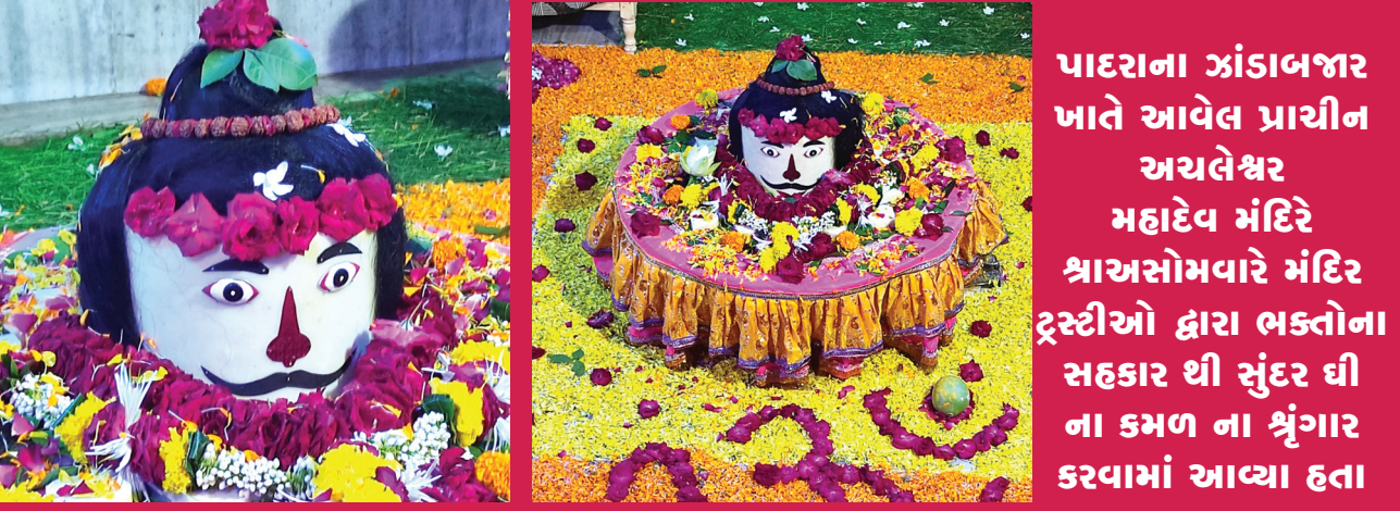
પાદરાના ઝંડાબજાર ખાતે આવેલ પ્રાચીન અચલેશ્વર મહાદેવ મંદિરે શ્રાવસોમવારે મંદિર ટ્રસ્ટીઓ દ્વારા ભક્તોના સહકાર થી સુંદર ઘી ના કમળ ના શ્રંગાર કરવામાં આવ્યા હતા